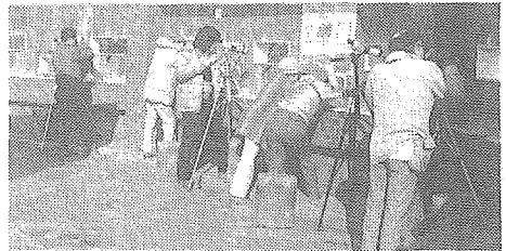
大井野鳥公園観察舎にて

人 33人 天気 晴 鳥 カイツブリ ゴイサギ コサギ マガモ カルガモ コガモ ハシブロガモ ホシハジロ タゲリ キジバト キセキレイ ハクセキレイ セグロセキレイ ヒヨドリ モズ ジョウビタキ ツグミ ウグイス シジュウカラ ホオジロ カシラダカ アオジ カワラヒワ シメ スズメ ムクドリ カケス ハシボソガラス ハシブトガラス 以上29種 タゲリ50羽くらいが見られて、東京からタゲリを見るために参加した人たちも満足。カモ500羽くらいも。