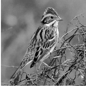
カシラダカ (編集部)

「要予約」と記載してあるもの以外、予約申し込みの必要はありません。集合時間に集合場所にお出かけください。初めての方は、青い腕章の担当者に「初めて参加します」と声をおかけください。参加者名簿に住所・氏名を記入、参加費を支払い、鳥のチェックリストを受け取ってください。鳥が見えたらリーダーたちが望遠鏡で見せてくれます。体調を整えてご参加ください。