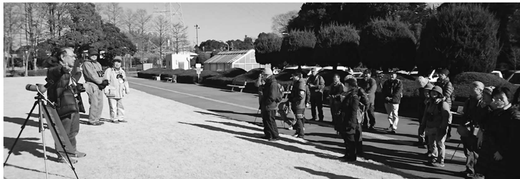
昨年1月4日のさぎ山記念公園探鳥会(編集部)

見どころ：旧浦和市上野田(野田の鷺山)にサギ類が集団営巣を始めたのは江戸時代徳川吉宗の時代。その後、1957(昭和32)年には親鳥、雛あわせて3万羽を数えたが、1972(昭和47)年には1対も巣を作ることはなかった。そんな歴史に思いを馳せながら新年最初の探鳥会にご参加ください。