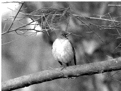
シロハラ（久保田忠資）

さいたま市桜区秋ヶ瀬公園 ◇10月13日、ピクニックの森とその付近の田んぼでチョウゲンボウ、バツらしきものを捕食していた。アカエリヒレアシシギ冬羽1羽、水面