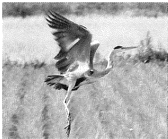
アオサギ(プリングマン・ウィリアム)

「要予約」と記載してあるもの以外、予約申し込みの必要はありません。初めての方も、青い腕章の担当者に遠慮なく声をおかけください。私たちもあなたを探していますので、ご心配なく。